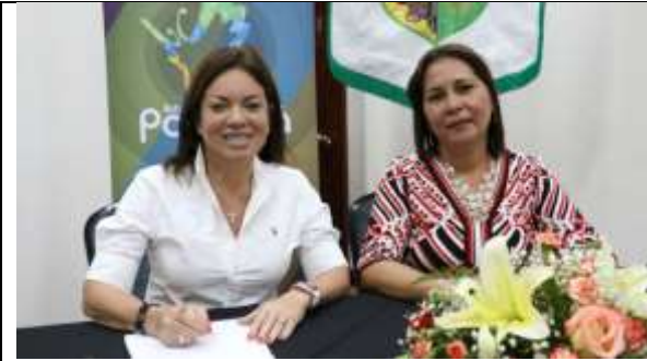
3 de julio, Firma de Convenio de Cooperación entre el Municipio de Antón y la ATP.