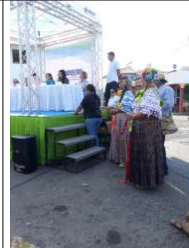
Primera Vereda Artesanal en distrito de Pedasí en colaboración con AMPYME-INADEH-MICI Dirección Nacional de Artesanía-Municipio de Pedasí-Cámara de Turismo de Pedasí