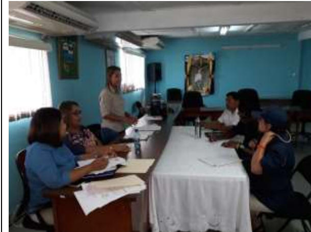
Reunión Comité de Gestión de Destino Turístico del Valle de Antón.