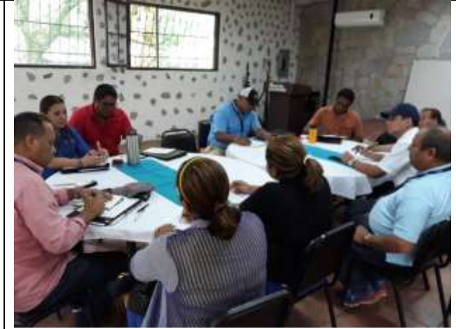
Reunión con el Municipio de Antón, Dirección Nacional de Artesanía y Junta Comunal sobre la planificación de la 2° versión de la Vereda Artesanal en el Valle de Antón.