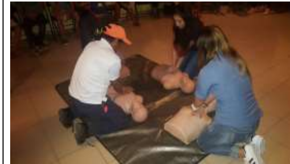
Seminario de Primeros Auxilios y Aguas abiertas.